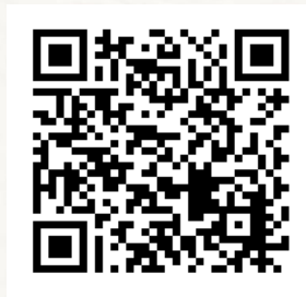
ภาพที่ ๒ QR code Youtube Channel ศูนย์เฉพาะกิจคุ้มครองและช่วยเหลือเด็กนักเรียน สำนักงานคณะกรรมการการศึกษาขั้นพื้นฐาน