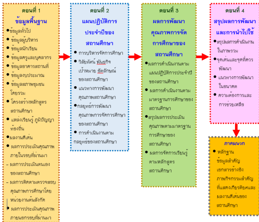
แผนภาพที่ 2 องค์ประกอบของรายงานการประเมินตนเองของสถานศึกษา (Self Assessment Report )

การจัดทำรายงานการประเมินตนเองของสถานศึกษา อาจแบ่งองค์ประกอบได้ดังแผนภาพที่ 2